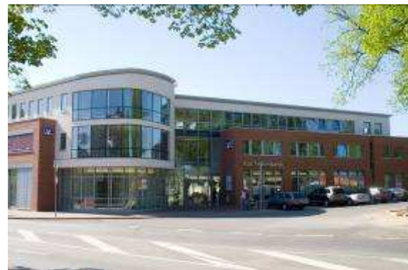
Neubau eines Markt- und Stabsgebäudes 24576 Bad Bramstedt, Am Bleeck 2 Schlüsselfertig