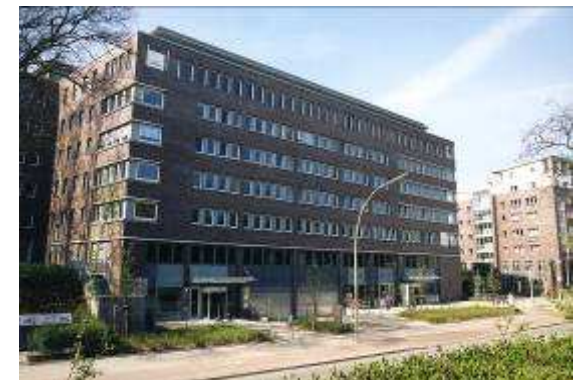
Neubau eines Büro- und Geschäftshauses 22767 Hamburg, Friedensallee 271 Rohbau