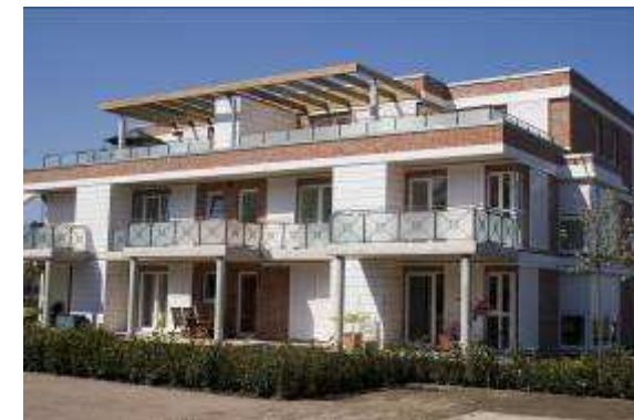
Neubau von 16 WE + TG 24558 Henstedt-Ulzburg, Kranichstrasse 5-7 Rohbau