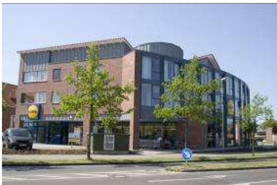
Neubau Wohn- und Geschäftshaus 24568 Kaltenkirchen, Hamburger Strasse 44-46 Schlüsselfertig