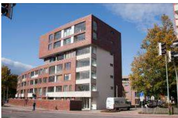
Neubau von 97 WE + TG 25335 Elmshorn, Schleusengraben/Reeperbahn Rohbau