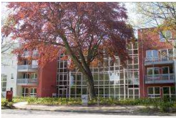
Neubau einer Seniorenwohnanlage 22339 Hamburg, Glashütter Landstrasse 9 Rohbau