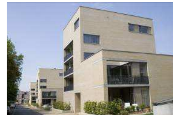
Neubau von 50 WE + TG 22147 Hamburg, Farmsener Zoll 9,15,19 / Am Knill 18 Rohbau