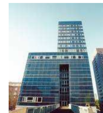
Neubau der Fachhochschule Hamburg 20099 Hamburg, Berliner Tor 5 Rohbau