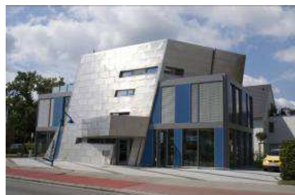
Neubau eines Geschäftshauses 22850 Norderstedt, Ulzburger Strasse 131 Rohbau