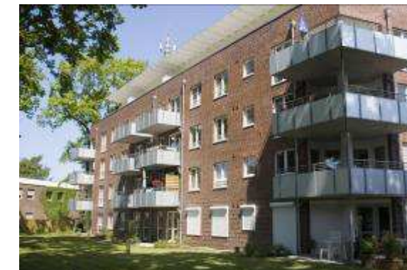
Neubau von 48 WE + TG 25469 Halstenbek, Bäckerstrasse 10-16 Rohbau