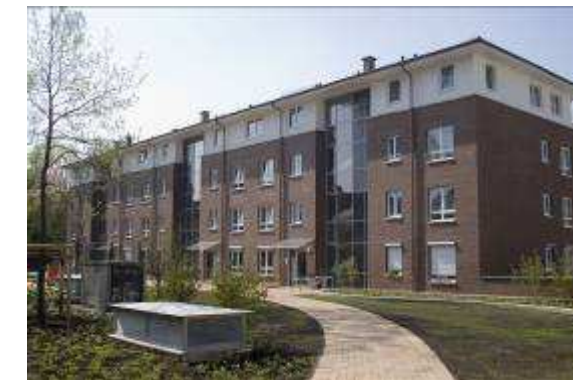
Neubau von 31 WE + TG 22880 Wedel, Kantstrasse 7-13 Rohbau