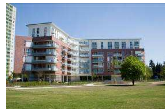
Neubau von 42 WE + TG 22850 Norderstedt, Lütjenmoor 15 a-c Rohbau